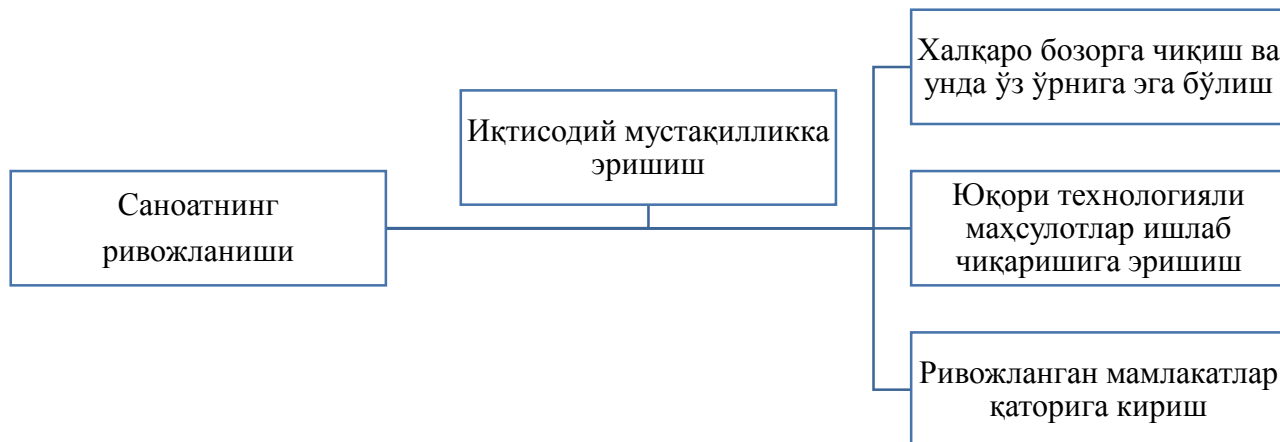
2-расм. Саноат ривожланишининг муҳим жиҳатлари.

Фикримизча, саноат тармоғининг ривожланиши мамлакатнинг ҳар томонлама барқарор ривожланиши билан бир қаторда унинг иқтисодий мустақилликка эришишига, халқаро бозор конъюнктурасига таъсир кўрсатишига, юқори технологияли маҳсулотлар ишлаб чиқаришга эришишига, ривожланган мамлакатлар қаторига киришига кенг имконият яратади (3-расм).