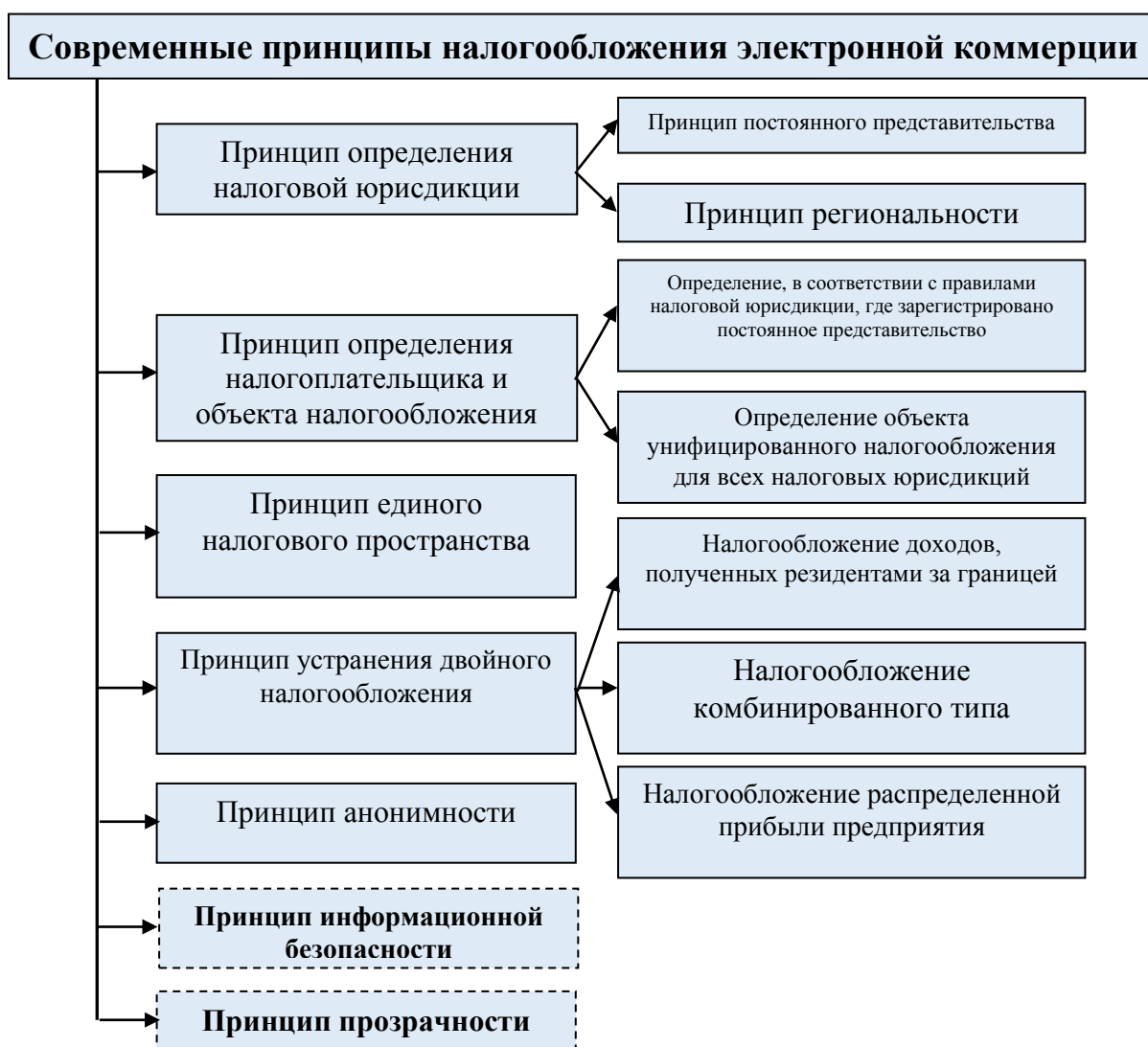
Рис.2. Современные принципы налогообложения электронной коммерции[18]

Сегодня электронная коммерция важна не только в наличии положительных аспектов для конкретного субъекта предпринимательской деятельности или потребителя, но и в социально-экономическом развитии страны. Следует отметить, что электронная коммерция, наряду с ее преимуществами, имеет и ряд недостатков, в частности, из-за налоговых потерь государственного бюджета сегодня электронная коммерция становится одной из главных проблем. Вот почему государства должны принять необходимые меры для приведения национальной налоговой системы в соответствие с требованиями современной информационной экономики. Налоговое законодательство в отношении этого процесса должно быть направлено на создание процесса налогообложения с учетом условий и возможностей субъектов электронной коммерции.