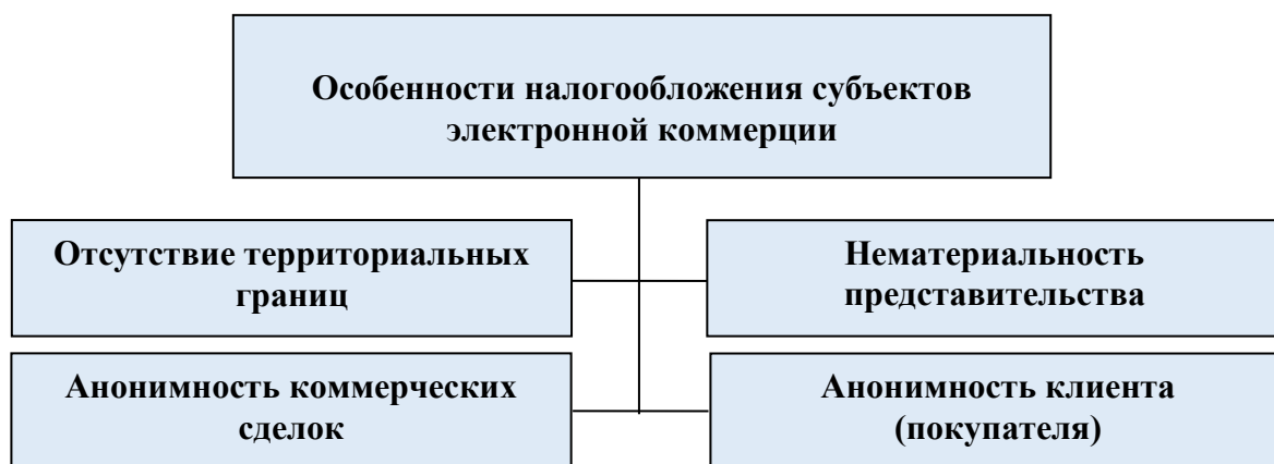
Рис.3. Особенности налогообложения субъектов электронной коммерции[18]

Преимущества электронной коммерции в перспективе проявляются как особое направление предпринимательской деятельности, однако они также способствуют значительным потерям в государственном бюджете. Вот почему важно определить особенности электронной коммерции и учитывать их в налогообложении в связи с необходимостью применения принципов, направленных на автоматизацию налогового контроля и разработки соответствующих платформ налогообложения в глобальной среде Интернета.