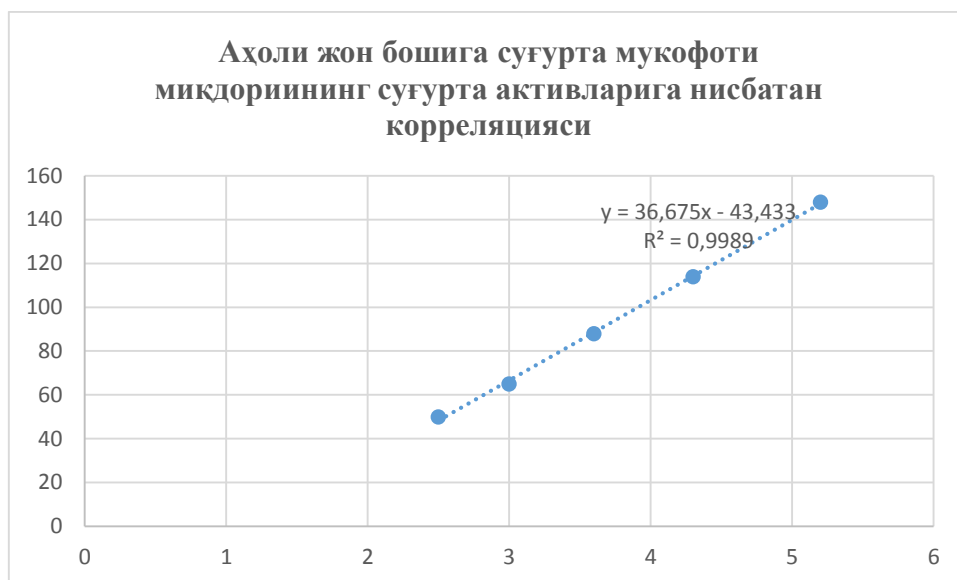
3-расм. Аҳоли жон бошига суғурта мукофоти микдориининг суғурта активларига нисбатан корреляцияси [12]