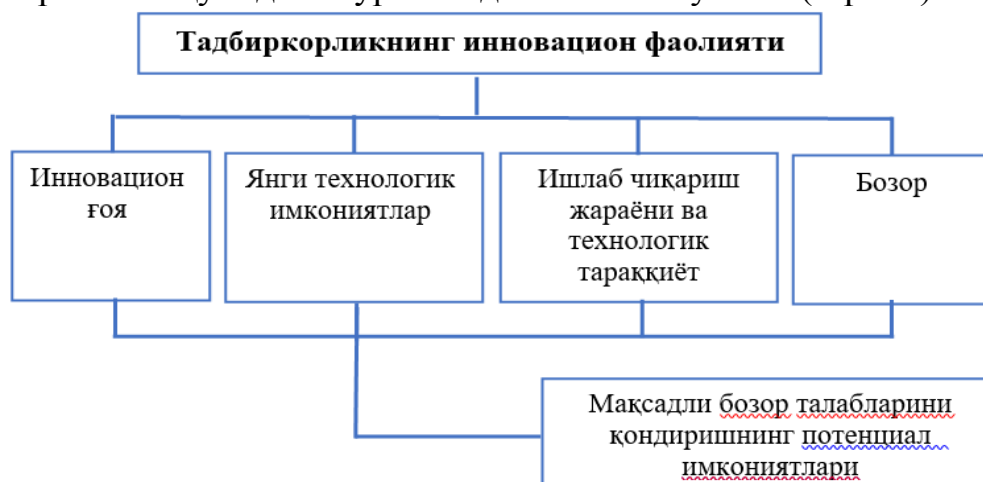
2-расм. Тадбиркорлик фаолиятини инновацион ривожланиши

Мамлакатимизда кичик бизнес ва хусусий тадбиркорлик фаолиятини бу каби қатор ривожланиш кўрсаткичлари соҳа фаолиятини мамлакат иқтисодиёти учун зарур аҳамият касб этишидан далолат беради. Аммо, соҳани ривожлантиришнинг потенциал имкониятларидан тегишли тартибда фойда-ланиш имкониятининг мавжуд эмаслиги, бу борадаги тизимли ислоҳотларни амалга ошириш жараёнида инновацион ғоялар, ишланмалар ва технология-ларни қўллаб-қувватлаш мақсадида инновацион менежментни ривожлантириш, янги ва талаб юқори бўлган маҳсулот (иш, хизмат)ларни ишлаб чиқиш бўйича инновацион лойиҳалар-стартапларни, жумладан, хорижда қўлланиладиган илғор услуб ва технологиялардан фойдаланган ҳолда ишлаб чиқиш, ишлаб чиқарилган инновацион маҳсулот (иш, хизмат)лар бозорларини шакллантириш билан боғлиқ инновацион ривожланиш йўналишларини шакллантиришни талаб этади. Фикримизча, соҳа фаолиятини инновацион ривожланиш йўналишларини шакллантириш жараёнини қуйидаги кўринишда асослаш мумкин (2-расм).