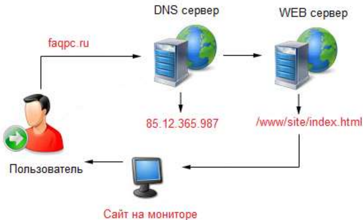
2-расм. DNS-сўровни ушлаб қолиш йўли билан Internet тармоғига ёлғон DNS-серверни киритиш.

4. Сервердан пакетни олишда пакетнинг IP-сарлавҳасидаги IP адресни ёлғон DNS-сервернинг IP-адресига ўзгартириш ва пакетни хостга узатиш (ёлғон DNS серверни хост ҳақиқий ҳисоблайди).