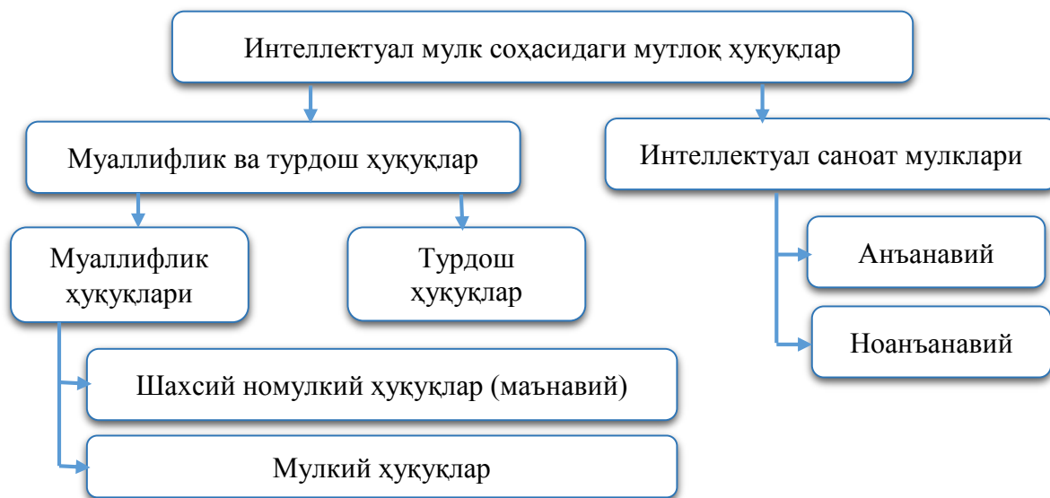
1-расм. Интеллектуал мулк ҳуқуқининг таснифи [10]

Қўйидаги 1-расмда интеллектуал мулк соҳасидаги мутлоқ ҳуқуқлар таркиби келтирилган.