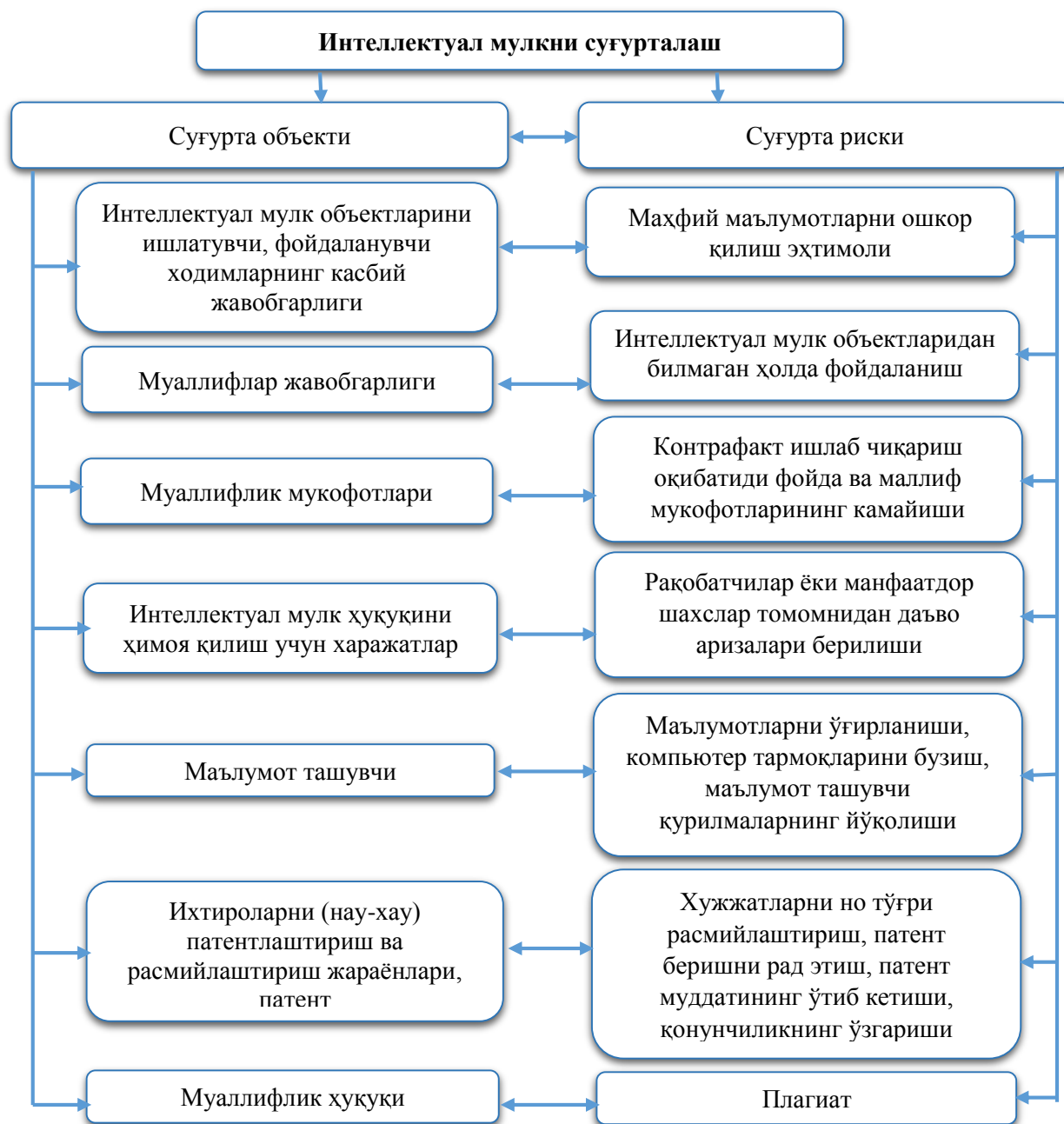
3-расм. Интеллектуал мулк суғуртасида суғурта рисклари 2

Интеллектуал мулкнинг ҳар бир объектига хос бўлган рисклар тўплами мавжуд (3-расм).