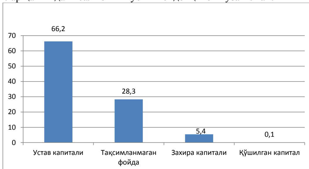
2-расм. Асакабанк регулятив капиталининг таркиби, фоизда (2019 йилнинг 1 январь ҳолатига кўра) [14]

бўлган. Бунинг устига, 2016-2018 йилларда Асакабанк регулятив капиталининг пассивлар ҳажмидаги салмоғини ўсиш тенденцияси кузатилган.