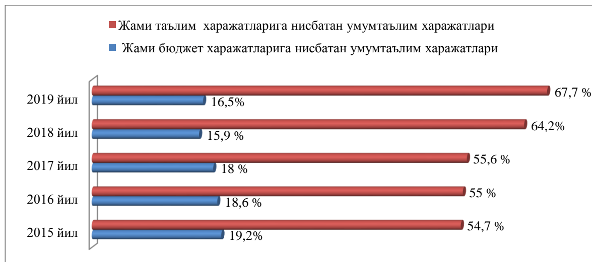
2-расм. Ўзбекистон Республикаси Давлат бюджети харажатлари таркибида умумтаълим харажатларининг улуши 2

Шу ўринда давлат бюджети харажатлари таркибида умумтаълим харажатларини улушини кўриб чиқамиз (2-расм).