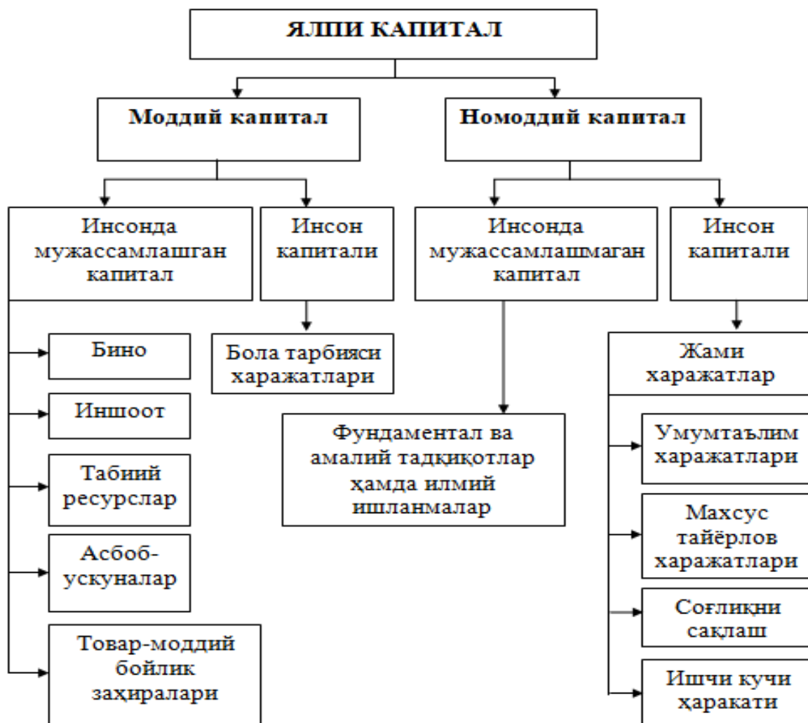
1-расм. Ялпи капитал таркиби. [6]

Фикримизча, капитални иккита, яъни, моддий ва номоддий капиталга ажратиш мақсадга мувофиқ.