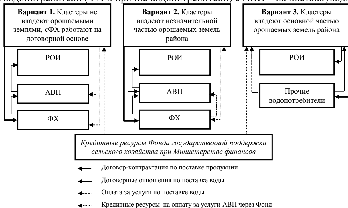
Рисунок 1. Современное состояние организационно-правовых и финансовых взаимоотношений агропромышленных кластеров с водохозяйственными организациями и водопотребителями 1

Вариант 3. АВП традиционно заключают договора с РОИ на водозабор, а водопотребители (ФХ и прочие водопотребители) с АВП – на поставку воды.