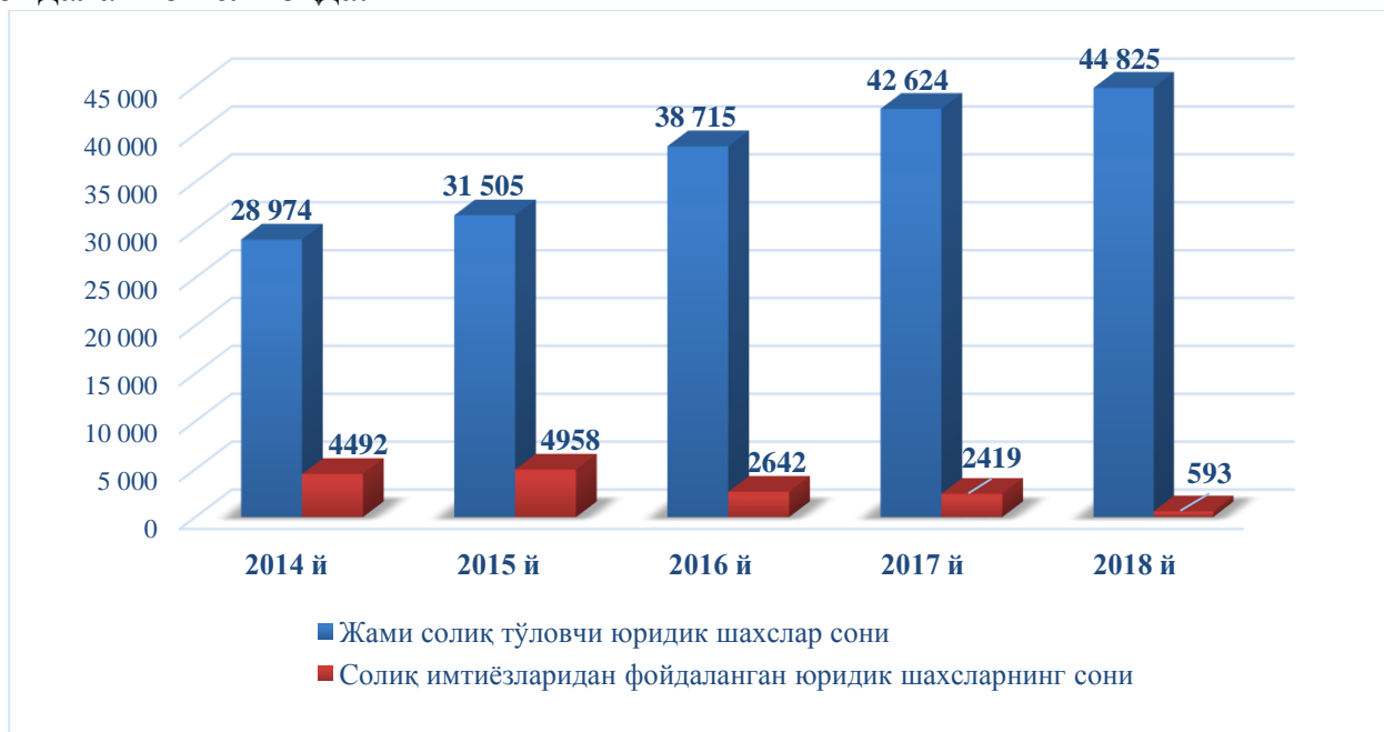
1-расм. Самарқанд вилояти бўйича солиқ имтиёзларидан фойдаланаётган юридик шахсларнинг сони[5], сонда

Самарқанд вилоятида мавжуд бўлган жами хўжалик юритувчи субъектлар ёки солиқ тўловчиларнинг ўртача 9,2 фоизи солиқ имтиёзларидан фойдаланиб келмоқда.