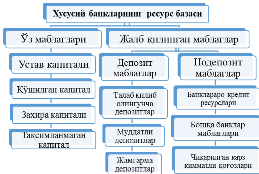
1-расм. Хусусий банкларнинг ресурс базасини шакллантириш механизми.

сотиб олинади ва иккинчидан, жалб қилиш ташаббуси банкнинг ўзига тегишли бўлади.