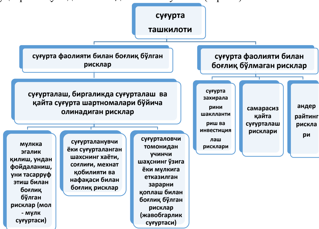
Расм 2.Рискларни таснифлаш 2

Хозирда республикада суғурталовчилар рискларини таснифлашга оид бирор ҳуқуқий меъёрий ҳужжат мавжуд эмаслиги сабабли, уларни турли олимлар турлича гуруҳларга ажратишмоқда. Суғурта рискларининг асосий гуруҳларини қўйидагича тақдим этиш мумкин (2-расм).