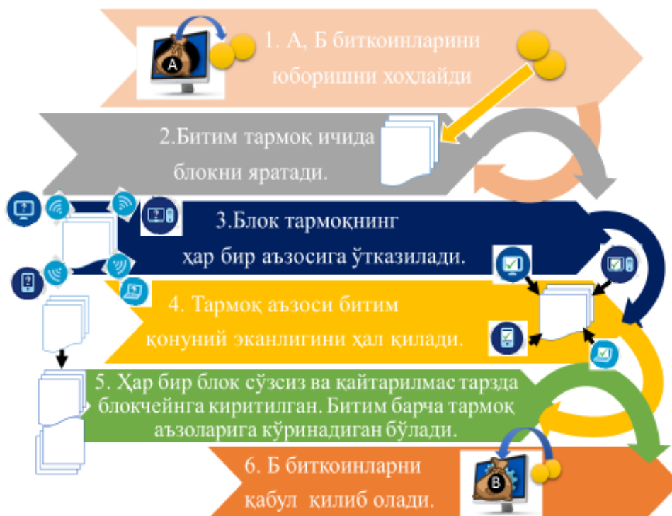
1-расм. Блокчейн биткоин технологиясининг ишлаш

Блокчейн биткоиннинг ишлашини куйидагича босқичда тавсифлаб бериш мумкин: операцияда иштирок этаётган иккала иштирокчичининг ҳам битим тузишга розилик билдириши; блокчейн технологиясидан фойдаланган ҳолда битим шифрланиши ва келишув асосида тасдиқланиши; кейинги босқичга ўтиш орқали битим мос келади ва у охириги блокчейн блокида блокировка қилинади; охириги босқичда блок занжири тармоқнинг барча тугунларида (иштирокчиларида) кўпайтирилади.