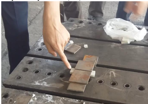
Рис.1. Собранные две металлические пластины и керамические подкладки.

Оценка влияния режимов сварки проводилась путем планирования дробного факторного эксперимента. В качестве входных независимых параметров были выбраны сила сварочного тока (основной уровень 450 А, диапазон варьирования 100 А) и скорость сварки (основной уровень 25 м/ч, диапазон варьирования 10 м/ч). Откликом являлись высота ( Y_1 ) и ширина корня шва ( Y_2 ).