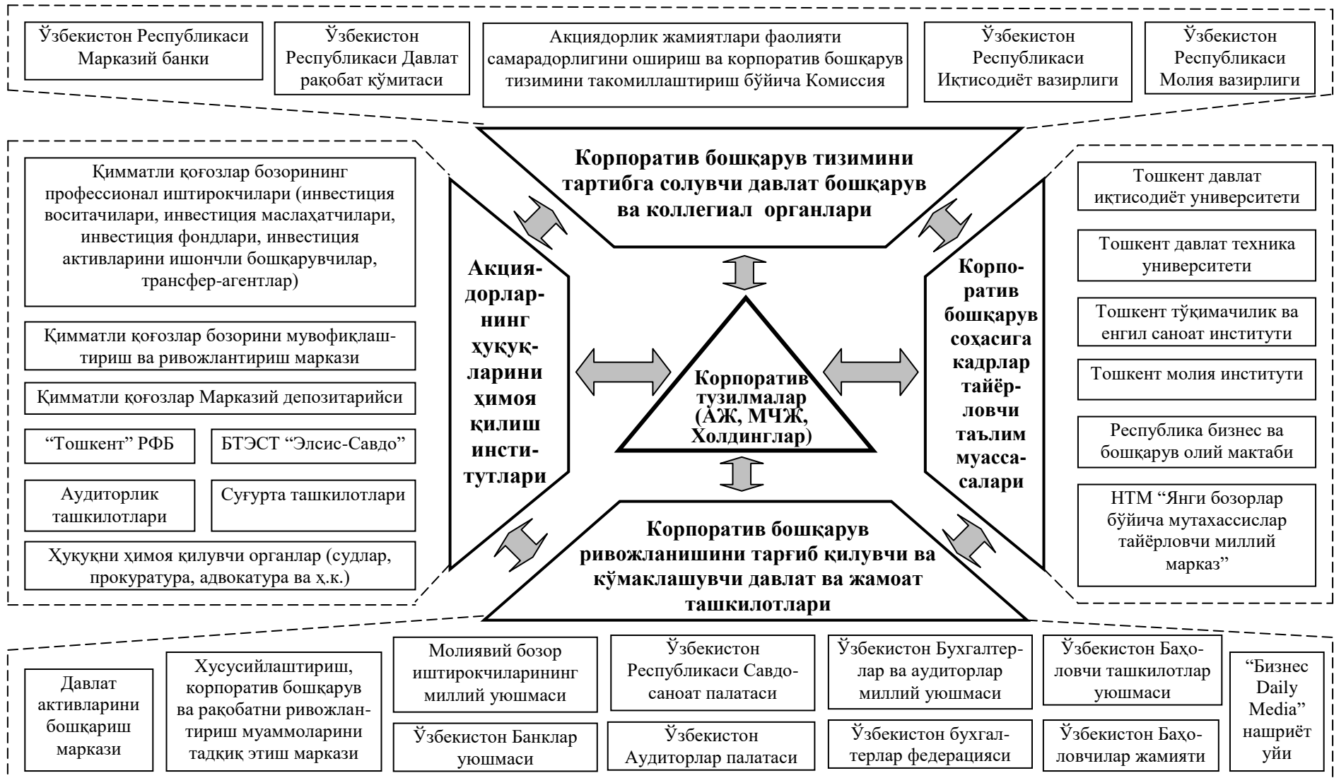
2-расм. Ўзбекистон Республикасида корпоратив бошқарув тизими (макродаражада) 3