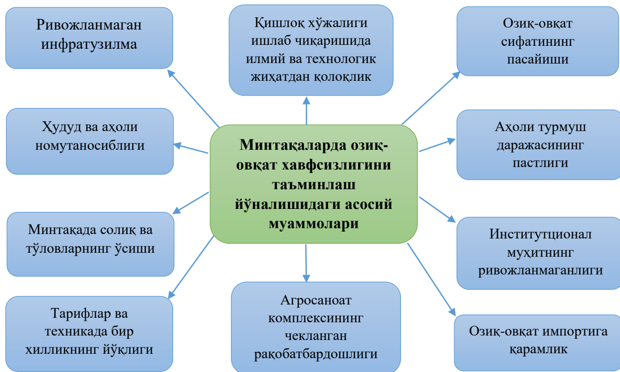
2-расм. Озиқ-овқат хавфсизлигини таъминлаш йўлидаги асосий муаммолар

Қозоғистонда озиқ-овқат хавфсизлигини таъминлаш муаммосини ҳал қилиш мақсадида агросаноат комплекси барқарор ривожланиш концепцияси 2010 йилгача ишлаб чиқилган бўлиб, аниқроғи, “2006-2008 йилларда Қозоғистон Республикаси агросаноат комплексини барқарор ривожлантириш концепцияси”ни амалга ошириш учун устувор тадбирлар дастури қабул қилинди. Дастур мақсадида агросаноат комплексининг барқарор ривожланишини таъминлаш, унинг филиаллари рентабеллиги ва меҳнат унумдорлигини ошириш, маҳаллий маҳсулотларнинг рақобатбардош устунликларини ишлаб чиқиш эди.