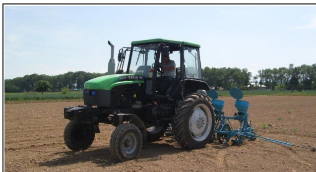
Рис.2. Посевной агрегат, состоящий из трактора с регулируемым клиренсом и сеялки

Сеялка СЧХ-4Б предназначена для пунктирного и пунктирно-гнездового посева с междурядьями 0,6; 0,7 и 0,9 м оголенными калиброванными семенами хлопчатника,