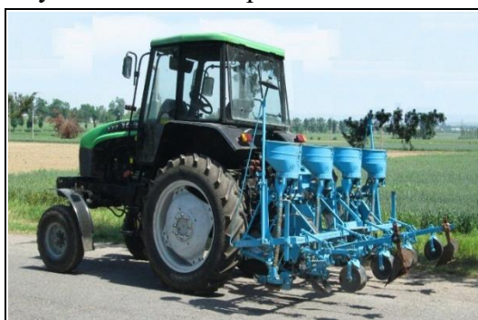
Рис.1. Трактор с регулируемым клиренсом в агрегате с сеялкой СЧХ-4Б.

В зоне хлопководства для обеспечения вписываемости конструкции в междурядья с развитыми кустами хлопчатника на серийно выпускаемых универсально-пропашных тракторах производят замену низкоклиренсного двухколесного переднего моста на высококлиренсную переднюю одноколесную ось и монтируют дополнительные конечные передачи. Это с одной стороны удорожает стоимость трактора, а с другой - требует дополнительных денежно-трудовых затрат. Но, несмотря на эти трудности для междурядной обработки посевов хлопчатника в зоне хлопководства в основном используют трехколесные универсально-пропашные тракторы, пренебрегая их недостатками по сравнению с четырехколесными тракторами [1]. Попытки использования для этой цели четырехколесных тракторов из-за недостаточной их агротехнической проходимости не увенчались успехом.