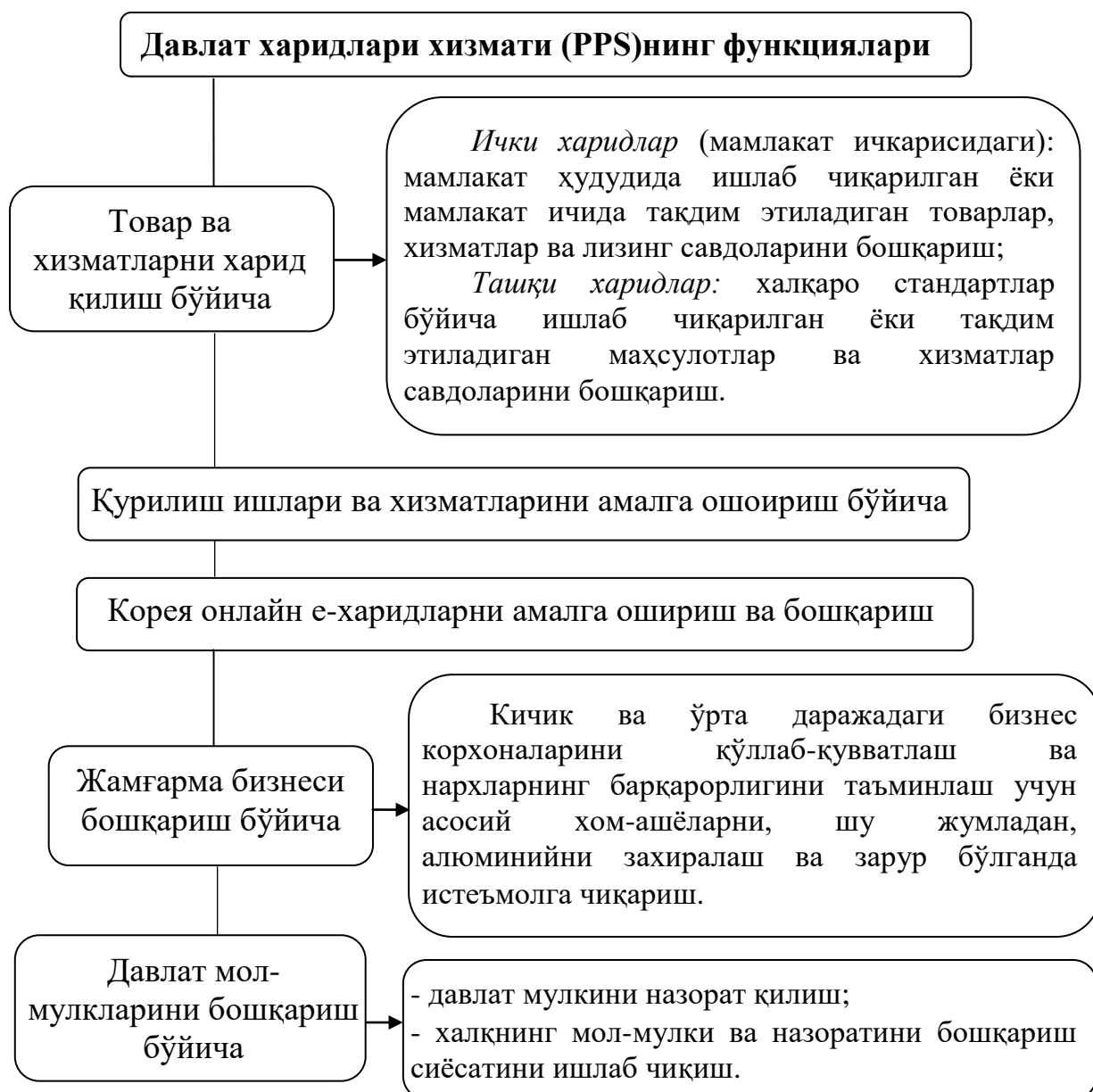
3-расм. Давлат харидлари хизмати (PPS)нинг функциялари [8]

Жанубий Кореяда давлат харидларининг ошкоралиги 2000 йилларининг бошида миллий харид тизими жорий этилганидан сўнг бошланган. 2002 йилда Жанубий Кореянинг давлат харидлари хизмати (PPS) ва марказий ташкилот агентлиги KONEPSнинг тўлиқ интеграциялашган электрон харид тизимини ишга туширди. Бу тизим барча харид жараёнини электрон тарзда амалга ошириш (тендерда иштирокчиларини бир вақтда рўйхатдан ўтказилиши, шартномалар ва тўловларни) ва ҳужжатлар алмашинувини онлайн тарзда амалга оширилади. Барча зарурий маълумотларни олиш, кенг қамровли хизматлар кўрсатиш, маълумотларни автоматик тарзда тўплаш, шунингдек, тендер иштирокчиларининг малакаси, етказиб бериш ва тўловларни электрон тарзда амалга ошириш учун 140 дан ортиқ ташқи тизимларга уланади ва керакли маълумотларни етказиб беради. Бундан ташқари, тизим керакли маълумотларни реал вақт оралиғида олиш имконини беради.