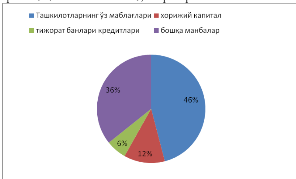
3-расм. Инновацияларнинг молиялаштириш манбалари, %да 8

(55,4 фоиз) ошган. 2016 йилда ташкилотнинг ўз маблағлари ҳисобидан молиялаштириш 2010 йилга нисбатан 6,4 баробар ошган.