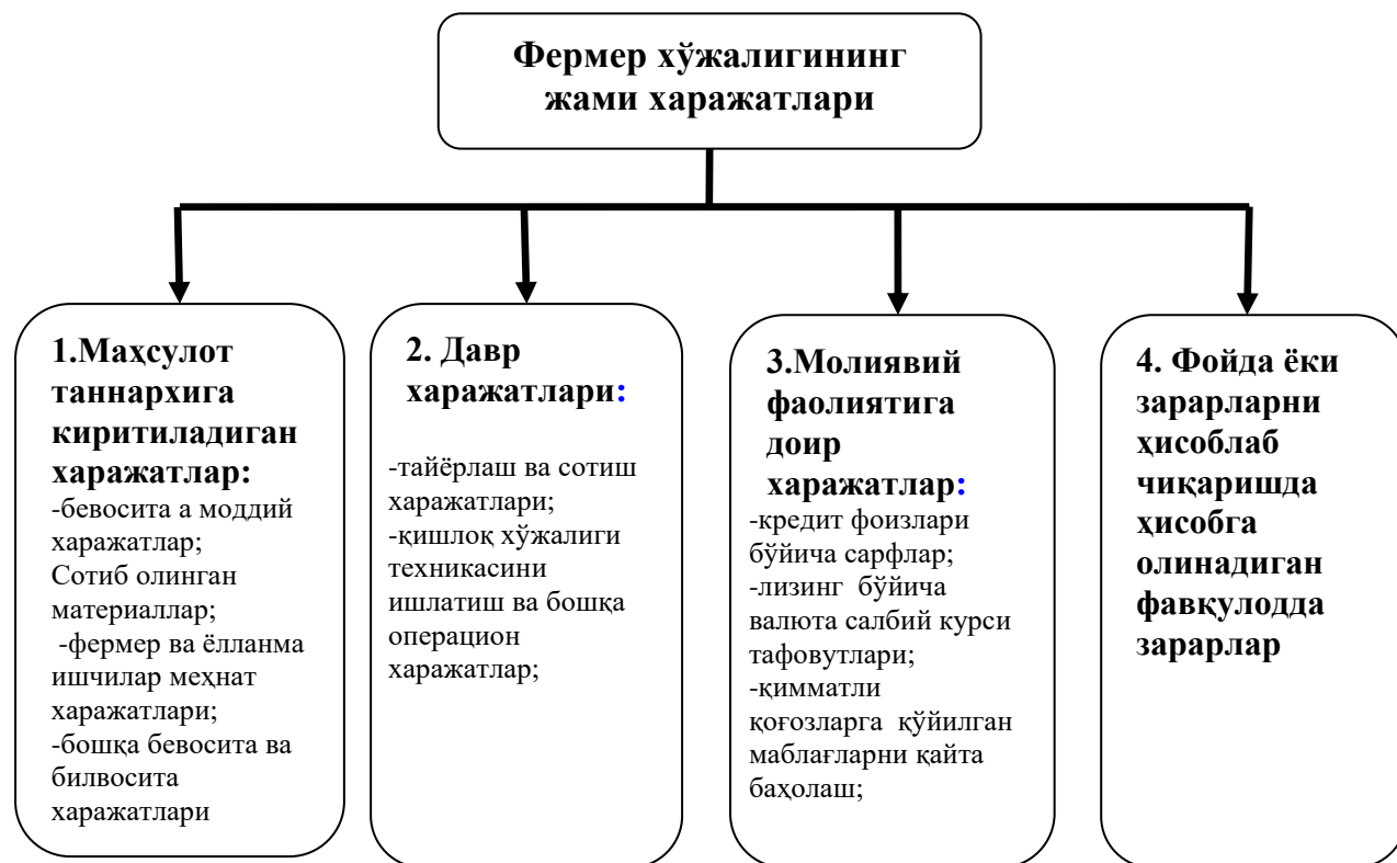
2-расм. “Маҳсулот (иш, хизмат)ларни ишлаб чиқариш ва реализация харажатларининг таркиби ҳамда молиявий натижаларни шакллантириш тартиби тўғрисида низом” асосида харажатларнинг таснифланиши 2 .

Фермер хўжаликларида ишлаб чиқариш харажатлари ва таннархни таҳлил қилиш энг қийин жараёнлардан ҳисобланади. Бунинг асосий сабабларидан бири харажатларни жуда чалкашиб кетганлиги ва уларни ҳисобга олишнинг мураккаблиги ҳисобланади.