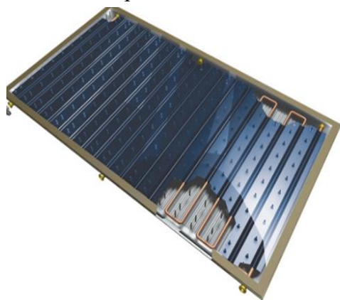
Рис 2. Вид плоского солнечного коллектора.

Установленные на южной стороне солнечные коллекторы, увеличивают количество поглощенной радиации.