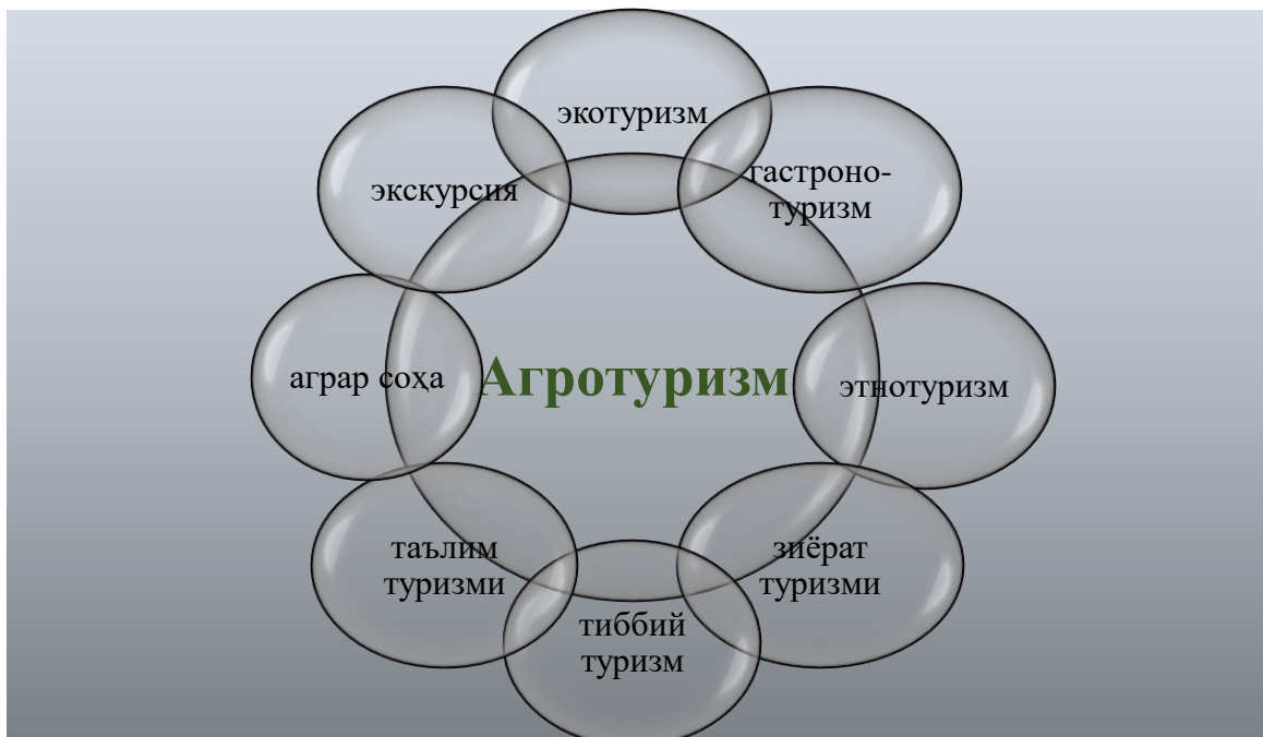
3-расм. Агротуризм таркибий қисмлари

Агротуризм туризмнинг бир нечта турини ўзида қамраб олиш имкониятига эгадир (3-расм).