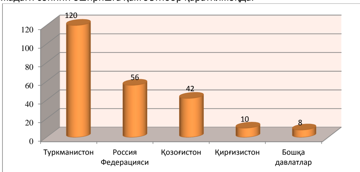
Расм 1. 2017/2018 ўқув йилида мустақил давлатлар ҳамдўстлиги мамлакатлари ва бошқа хорижий давлатларидан қабул қилинган талабалар сони, киши.

Бу, шундан далолат берадики мамлакатимиз таълим сифатини ошириш ва салоҳиятли кадрлар орқали, таълим инфратузилмасини янги босқичга кўтариш мақсадида амалга оширилаётган чора-тадбирлардир. Албатта, нафақат мамлакатимиз фуқароларининг хорижий олий таълим муассасаларида янги билим кўникмасини шакллантириш, балки, хорижий давлат фуқароларининг сезиларли даражадаги сонини оширишга ҳам эътибор қаратилмоқда.