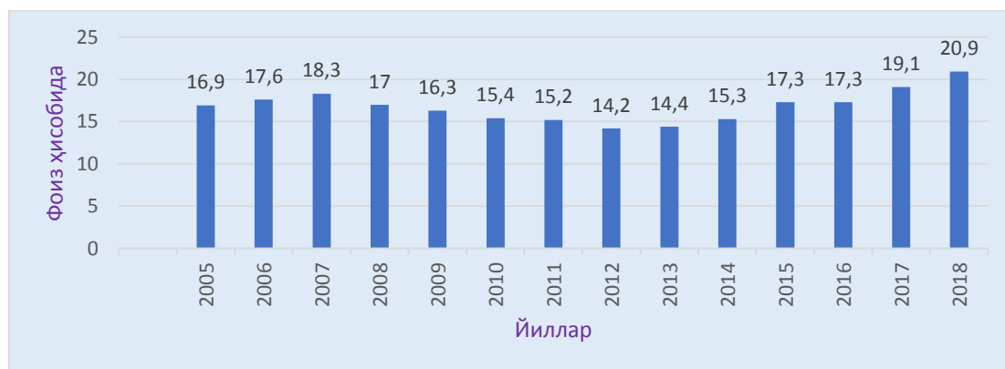
2-расм. 1-6 ёшгача мактабгача тарбия муассасаси қамрови[8]

Давлатнинг касб-ҳунар таълими тизими билан иш берувчи ўртасидаги ҳамкорлик фикримизча, қачонки ҳар икки томон манфаати қондирилганда янада ривожланади. Ишга киришдан олдин юқори сифатли умумий таълим инсоннинг бутун иш фаолияти давомида янги кўникмаларга эга бўлишининг энг яхши кафолати бўлиб, шунингдек, иш берувчининг бундай ходимни касбий тайёргарлигига сармоя киритишдан манфаатдор бўлишидир. Шунинг учун сўнгги йилларда мамлакатимизда мактабгача тарбиядан бошлаб, бошланғич ва ўрта мактаб фаолиятига катта эътибор қаратилмоқда. Ҳукуматимиз Республика аҳолисининг мисли кўрилмаган ўсишига қарамай, мактабгача тарбия муассасасига ёзилиш даражасини кескин оширишга муваффақ бўлмоқда.