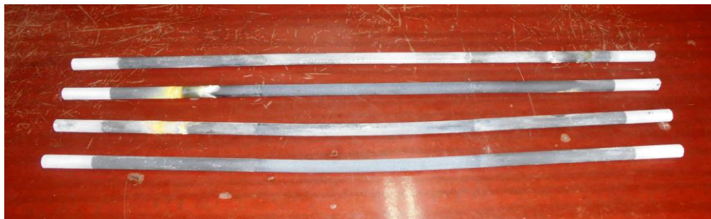
Рис.3. Карбидокремниевые нагревательные элементы, пришедшие в непригодное состояние.

( R ) нагревателя и выключается печь. При этом нагреватели остаются в печи до полного остывания (до комнатной температуры) при закрытых дверцах.