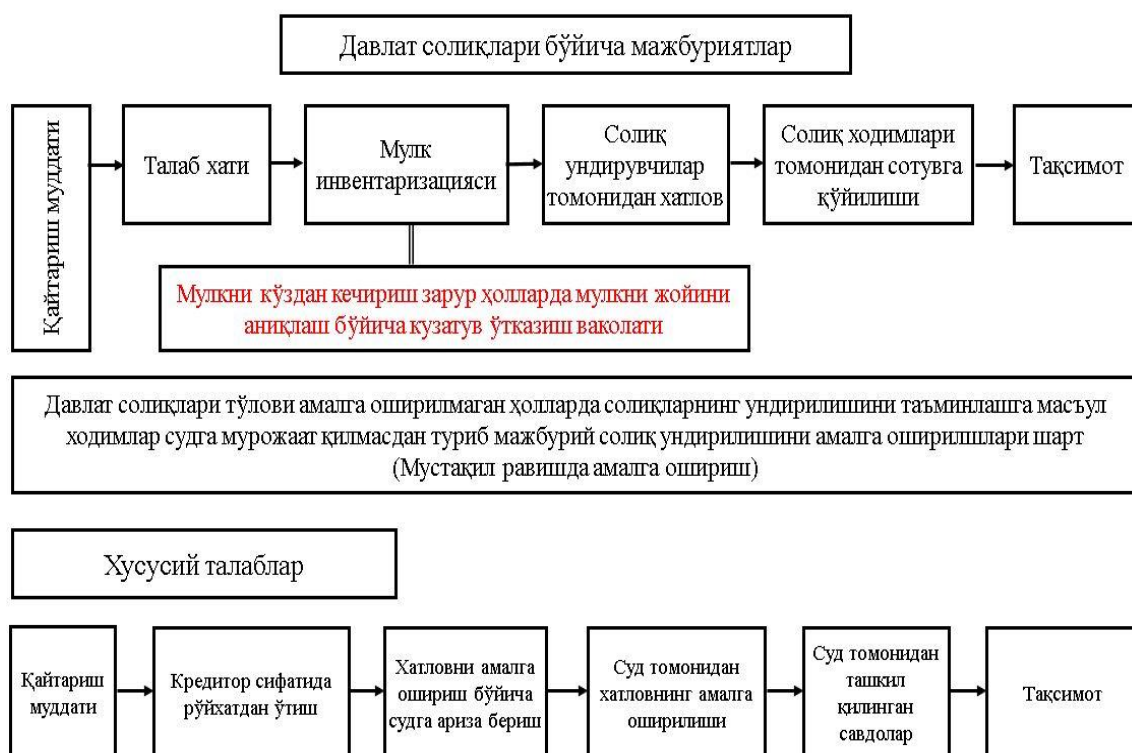
1-расм. Японияда солиқ қарздорлигини мажбурий ундириш механизми [18]

Бу борадаги илғор хориж тажрибасини ўрганар эканмиз, Японияда солиқ тўловчи қонун билан белгиланган муддатдан кечикиб солиқ тўловини амалга оширганда дастлабки кечиктирилган икки ой учун 4,5 % йиллик миқдорда (фоиз ставкалари банкнинг қайта молиялаштириш ставкасидан келиб чиқиб ҳар йили ўзгартирилади), иккинчи ойдан ошган қисмига 14,6 % йиллик фоиз миқдорда молиявий чоралар қўрилади (1-расм).