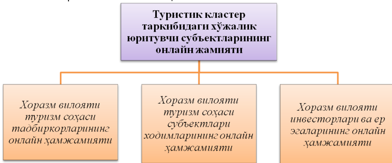
2-расм. Хоразм вилояти туристик кластери таркибидаги хўжалик юритувчи субъектларининг онлайн жамияти

Биз онлайн жамият ишини оптималлаштириш учун барча онлайн ҳамжамиятлар таркибига кирувчи Хоразм вилоятининг нотижорат ташкилот-лари, тадбиркорлар бирлашмалари, корхоналар ходимлари фаолияти билан барчани хабардор қилиш ва ташкил қилинадиган ҳамжамиятлар иши самарадорлигини ошириш учун ягона комплекс ахборот тизимини ташкил қилишни тавсия этамиз.