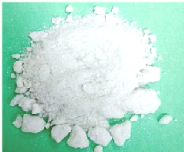
2 и 3 ФРАКЦИИ БГТФ