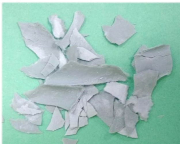
1- ФРАКЦИЯ ДИМЕР. ТРИМЕР