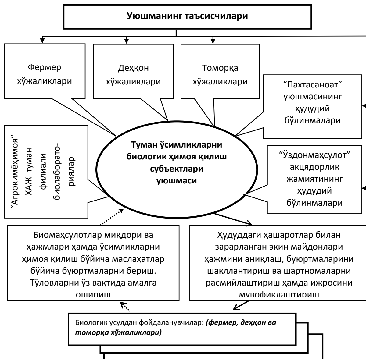
3-расм. Туман ўсимликларни биологик ҳимоя қилиш бўйича хизмат кўрсатувчи субъектлар уюшмаси фаолият механизми чизмаси 1

Фикримизча ҳудудда пайдо бўлган зараркунанда ва касалликларга самарали кураш олиб бориш учун, яъни зарарланган ҳудудни тўла қамраб олиш учун “Туман миқёсида ўсимликларни биологик ҳимоя қилиш субъектлари уюшмаси” ни ташкил этиш мақсадга мувофиқ деб ҳисоблаймиз (3-расм).