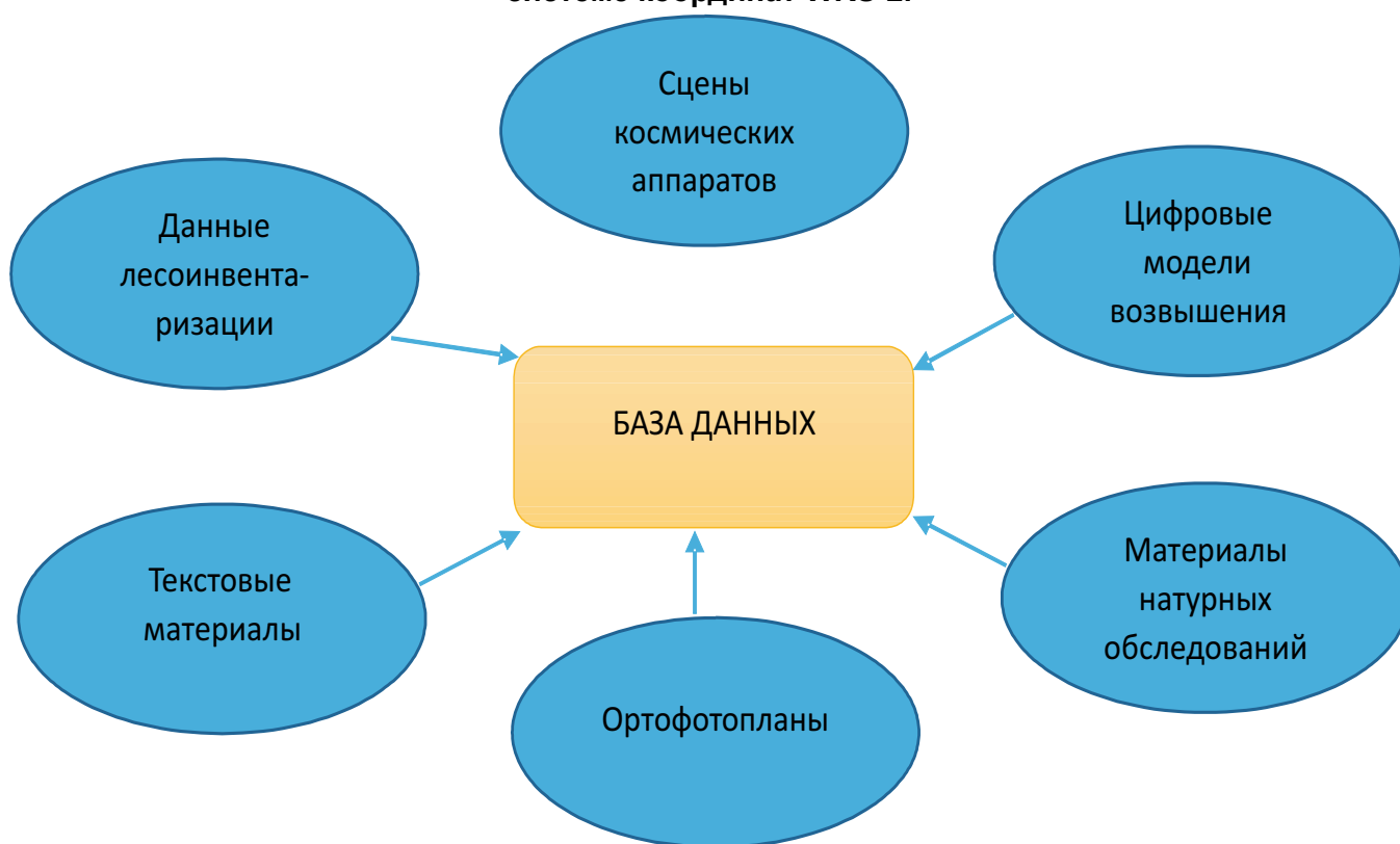
Рис. 3. Источники информации при выборе эталонных данных.