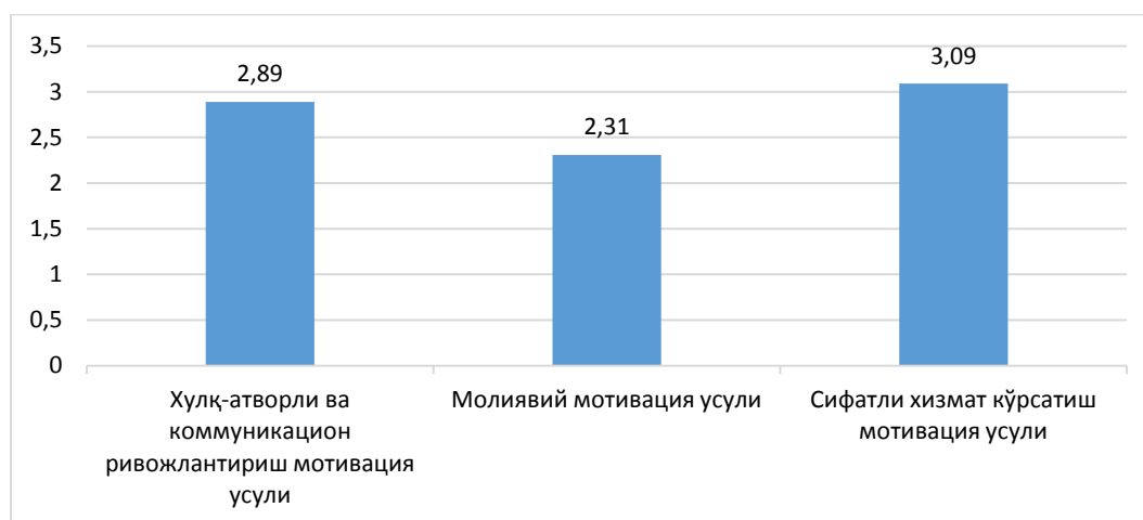
1 – расм. Корхонада воситачиларга йўналтирилган мотивация усулларидадан фойдаланиш ҳолати