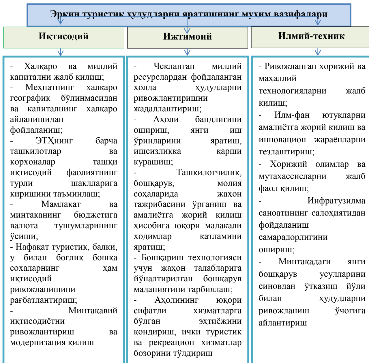
2-расм. Эркин туристик ҳудудларни яратишнинг муҳим вазифалари

ЭТХларни барпо қилиш қуйидаги масалаларни ҳал қилиш кўзда тутати: