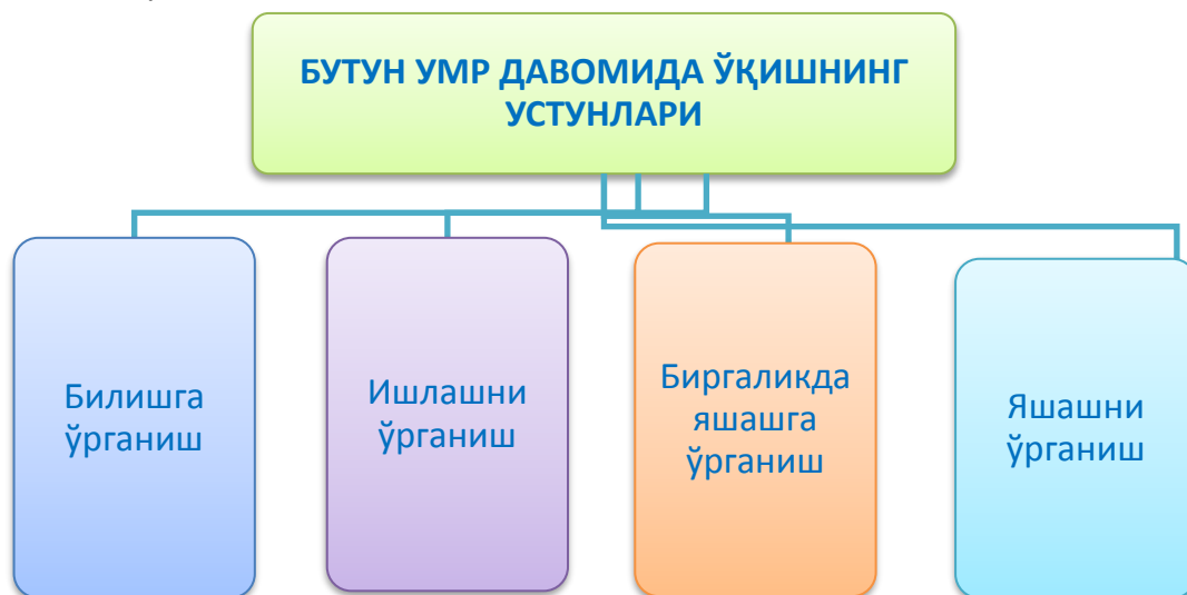
1.3–расм. ЮНЕСКОнинг бутун ҳаёт давомида таълим олиш устунлари[16]

Маърузада бутун ҳаёт давомида таълим олиш тўрт устунга таяниши лозимлиги таъкидланади (1–расм):