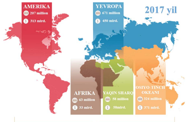
Jami turistlar: 1 323 million Jami turizm daromad: 1 225 mlrd. AQSh dollar

Mintaqalarda turistik bozorlarning rivojlanish darajasi turlicha bo‘lib, turistlar tashrifi hamda ulardan olinadigan daromadlar ham notekis taqsimlangan. Jahon turistlarning 51 foizi Yevropa mintaqasiga to‘g‘ri kelsa, jahon turizmining yalpi daromadidagi ulushi 37 foizni tashkil etadi. Aksincha, AQShga tashrif buyuruvchi turistlar dunyo turistlarning 16 foizni, yalpi daromadning esa 25 foizi to‘g‘ri keladi (1-rasm). Shuningdek Shimoliy Amerika turizm sohasida yaratilgan mahsulot va xizmatlarning 83 foizi va global ulushning 18 foizi aynan AQSh hissasiga to‘g‘ri keladi.