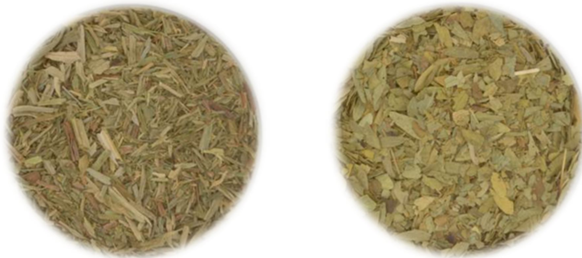
Мотор ( Allium motor )