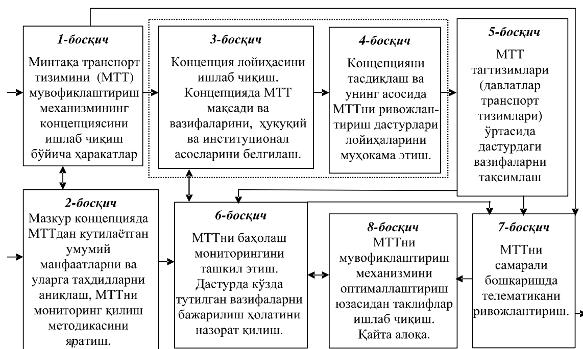
2-расм. Марказий Осиё транспорт тизимини мувофиқлаштириш механизминини шакллантириш босқичлари 1

ни мониторинг қилиш методикасини аниқлаш. Ушбу босқичда соҳа экспертлари, олимлари билан бир қаторда расмий идоралар ва ташкилотлар вакиллари иштирокидаги учрашувларни ташкил этиш тавсия этилади. Ушбу учрашувларда ишчи гуруҳларни шакллантириш ва мазкур гуруҳлар фаолиятини ташкиллаштириш мақсадга мувофиқ бўлади. Шунингдек, минтақавий транспорт тизимини баҳолашда индикатив ёндашув асосида ишлаб чиқилган муаллифлик методикасидан фойдаланиш мумкин.