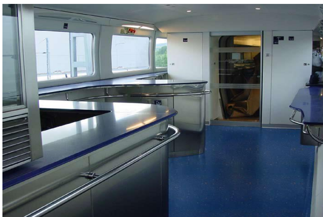
Рисунок 3. Вагон-ресторан поезда «Афросиёб»

Сразу возникает вопрос о хранении мелкой почты в высокоскоростном поезде «Афросиёб». Так как, данный поезд очень хорошо оснащен сидячими местами, правильно укомплектован каждый вагон, и расположение каждой вещи имеет важное значение. Но, стоит отметить, что мелкие посылки не занимают большого места и для их перевозки можно использовать переносной ящик с замком, который будет перемещаться одним человеком, то есть ответственным лицом. Данный ящик будет иметь габаритные размеры: 60x40x50 см (рис.2.) или другие размеры, по размерам мелких посылок. Данный ящик будет находиться в пути следования в вагоне-ресторане (рис.3.)