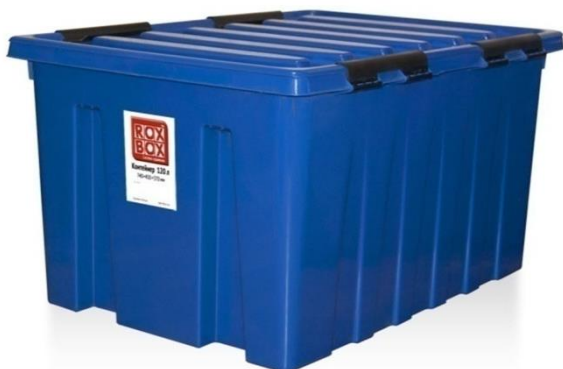
Рисунок 2. Пластмассовая тара для перевозки

Сразу возникает вопрос о хранении мелкой почты в высокоскоростном поезде «Афросиёб». Так как, данный поезд очень хорошо оснащен сидячими местами, правильно укомплектован каждый вагон, и расположение каждой вещи имеет важное значение. Но, стоит отметить, что мелкие посылки не занимают большого места и для их перевозки можно использовать переносной ящик с замком, который будет перемещаться одним человеком, то есть ответственным лицом. Данный ящик будет иметь габаритные размеры: 60x40x50 см (рис.2.) или другие размеры, по размерам мелких посылок. Данный ящик будет находиться в пути следования в вагоне-ресторане (рис.3.)