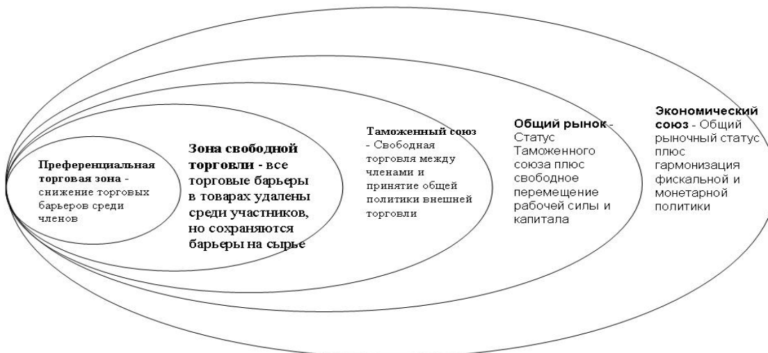
Рис. 2. Этапы развития региональной экономической интеграции.

Термин «экономическая интеграция» стали употреблять в 1930-е годы немецкие и шведские экономисты, однако до сих пор для термина