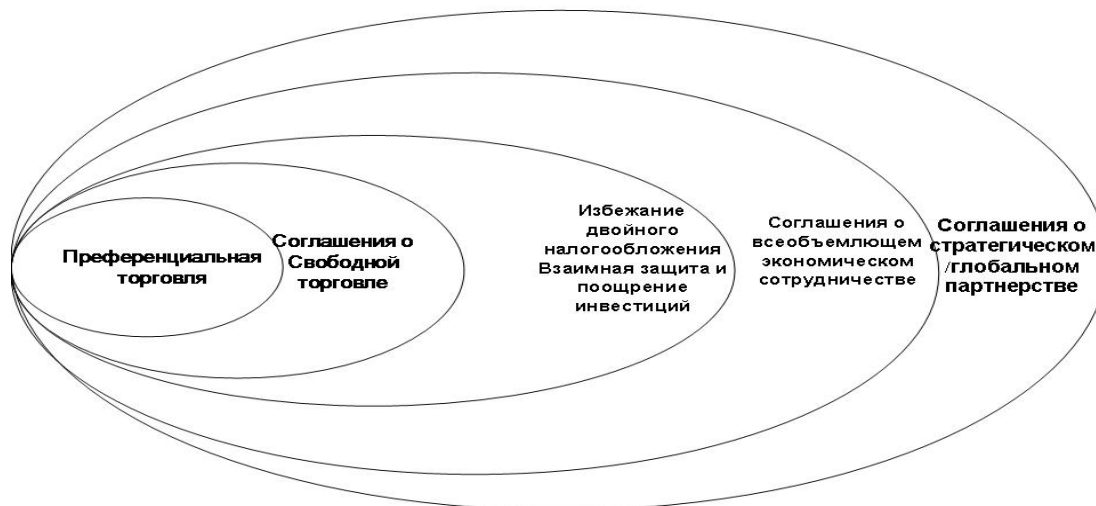
Рис. 1. Этапы развития экономического сотрудничества.

экономической интеграции. Первое имеет свои этапы развития (рис.1) и не затрагивает государственного суверенитета, в то время как второе (рис.2) предполагает добровольное ограничение суверенитета государств-членов.