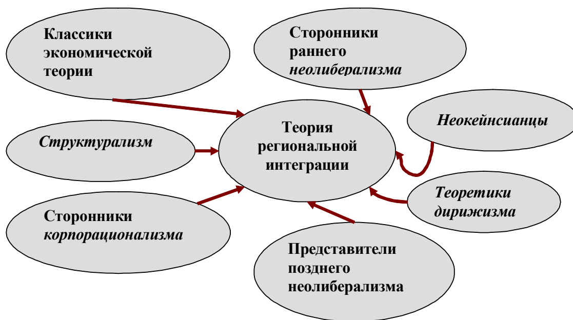
Рис. 4. Структура теории региональной экономической интеграции.

Сторонники корпорационализма (С.Рольф, У.Ростоу) считали, что интегрирование международной экономики способны обеспечить не рыночный механизм и государственное регулирование, а международные корпорации, функционирование которых способствует рациональному и сбалансированному развитию мирохозяйственных связей.