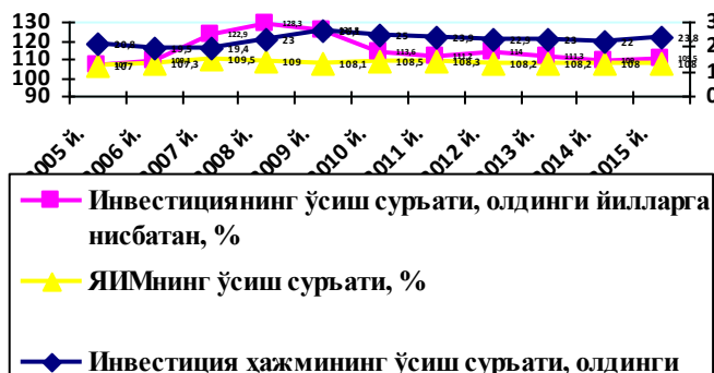
2 - расм. Ўзбекистон иқтисодиётига жалб қилинган инвестициялар ўсиш суръати.

Инвестиция - инновация riskлари инвестиция лойиҳаларининг ҳаётийлик циклининг айрим даража ва босқичларида пайдо бўлади ва шунинг учун риск омилларини аниқлаш ҳамда уларни камайтириш бўйича чора - тадбирлар ишлаб чиқиш инновация лойиҳасининг ҳар бир босқичларида амалга оширилиши керак. Ушбу ҳолат бу каби рискларни бошқариш жараёнида муҳим рол ўйнайди.