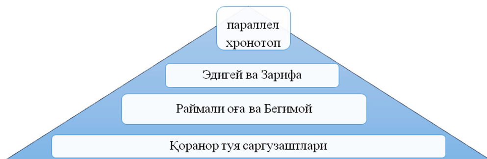
3-расм. Учта сюжет чизиғининг параллел хронотоп асосидаги пирамидаси.

2. Собитжон – Жўломон макроолам хронотопи: марҳум отасининг васиятига беписанд қараган, ҳатто мотам маросимида халал берган Собитжоннинг шу қадар тубанлигини жунжанглар қўлида асир тушган ва хотирасидан бутунлай маҳрум этилган Жўломон образи билан параллел тасвирланиши, яъни Собит-