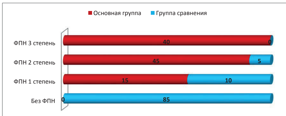
Рис.2 Допплерометрическое исследование гемодинамики в системе «мать-плацента-плод» у беременных женщин.

(n=11) женщин, на четвертом – гестоз у 35% (n=7), в меньшей степени выявлено ОРВИ 25%(n=5) (рис.1) В группе сравнения: ведущее место занимает анемия 30% (n=6) и угроза 30% (n=6), затем ОРВИ 20% (n=4), лишь на третьем месте ФПН 15% (n=3) и гестоз 15% (n=3).