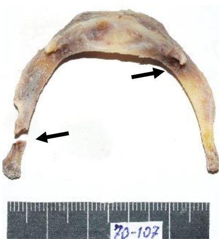
Рис 1. Вид сверху подъязычной кости покойного Ф.Х. с полным косопоперечным переломом левого большого рожка и правого конца тела (указано стрелкой).