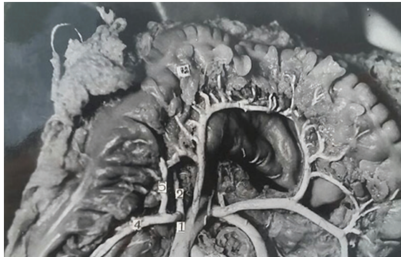
Рис. 1. Мальчик 4-х лет. Образование желудочно-ободочной вены: желудочно-ободочная вена (1); правая желудочно-сальниковая вена (2); правая ободочная вена (3); нижний приток правой ободочной вены (4); верхний приток правой ободочной вены (5).